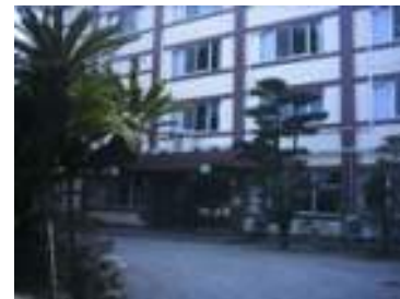
《伊勢青少年研修センター正面》

公益財団法人修養団(SYD) 伊勢道場/伊勢青少年研修センター 〒516-0024 三重県伊勢市宇治今在家町 153 〔TEL〕 0596(25)0265 〔FAX〕 0596(25)0309 〔URL〕 http://www.syd.or.jp/ise/ 〔E-mail〕 ise@syd.or.jp