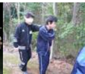
ブラインドウォーク